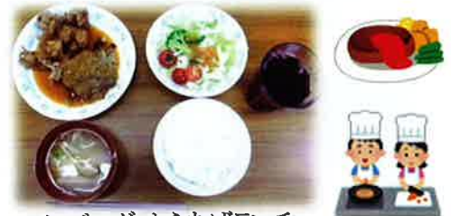
ハンバーグ・からあげランチ

5月28日(土)に、森の工房みみずく就B(あき)のぶるーべりー班とひいらぎ班は、第2森の工房の多目的室と会議室を使用して合同の班研修を行いました。午前中は全員で協力してお昼ご飯をつくり、午後からは映画を観ました。ハンバーグにからあげとボリューム満点のメニューにみんなお腹いっぱいになりました。